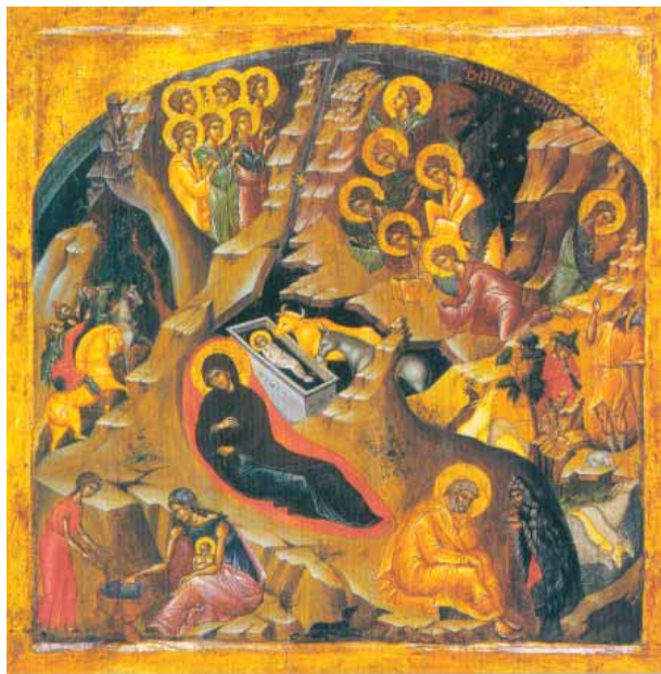
Icône de la Nativité de Notre Seigneur Jésus Christ